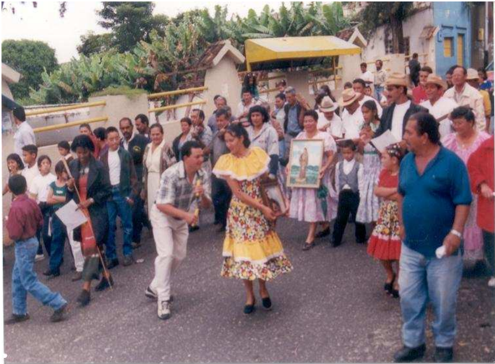
Fiesta en honor a San Pascual bailón. Se celebra el 3 er domingo de mayo en Sanare