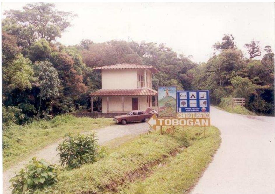
Entrada al parque nacional Yacambú, municipio Andrés Eloy Blanco

Para visitar y pasar un agradable momento de inolvidables apreciaciones están: El Parque Nacional Yacambú, con una flora y fauna, Yay y la Hundición con sus mitos y leyendas, la enigmática Fumarola o Volcán de Sanare investigada desde 1832, el sitio de la Cruz de la Angostura con su paso de aves migratorias, El Blanquito para acampar, dormir o darse un buen baño, la iglesia Santa Ana de Sanare para admirar sus altares, imágenes, la primera copia de Nuestra Señora de Coromoto y el retablo de Santa Ana con unos 400 años de existencia y es así como sus plazas, parques, Loma Curigua, bosques, montañas y diversas quebradas que se prestan para pasar días de sano entretenimiento y saborear sabrosas parrillas, sancochos y comidas al aire libre.